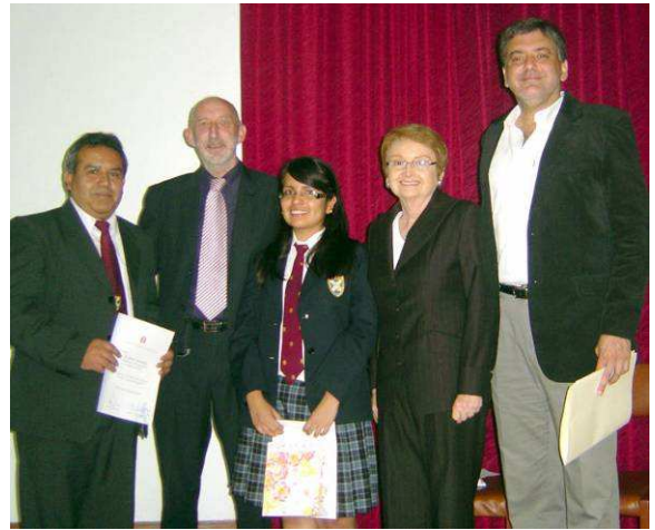
La joven ganadora del primer premio del concurso literario en Perú (en el centro).