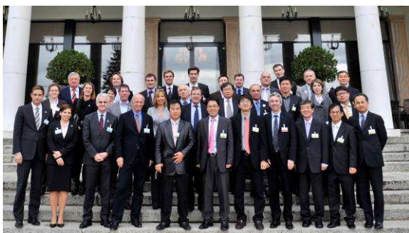
Los participantes en el seminario

Tal como anunciamos la semana pasada, los representantes de las tres ciudades aspirantes a la organización de los Juegos Olímpicos de Invierno de 2018 –Annecy (Francia), Múnich (Alemania) y PyeongChang (República de Corea)– participaron en un seminario de información en Lausana. Este seminario abordó varios temas clave, como el legado y el progreso en el ámbito económico, medioambiental y social. Se animó a los representantes de las tres ciudades a empezar a preparar estos temas lo antes posible. Además, después del seminario, los comités de candidatura de las tres ciudades aplicarán lo aprendido a sus preparativos, antes de viajar a Vancouver, el próximo mes de febrero, para participar en el programa de observadores. Más información en www.olympic.org . Además, durante la reunión de la CE celebrada esta semana, se efectuó un sorteo para decidir el orden oficial de las ciudades aspirantes. El orden resultante es el siguiente: Múnich, Annecy, PyeongChang. Durante todo el proceso de candidatura se utilizará este orden cada vez que se mencionen las ciudades en comunicados de prensa, en los documentos del COI, en las presentaciones de las ciudades, etc.